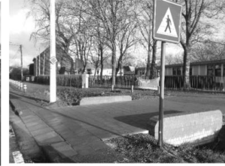
Ingang voetgangers en fietsers.

We zijn er ons van bewust dat we niet over een grote parking beschikken. Daarom stellen we als alternatief voor dat u parkeert in de Gaspardkouterstraat of Boelenaar .