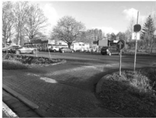
Deze parking is enkel voor de leerlingen die met de wagen komen.

Wij, het ganse schoolteam en u, de (groot)ouders MOETEN de kinderen het juiste voorbeeld geven. Hoe kunnen wij anders onze kinderen later vertrouwen in het dagdagelijkse verkeer? Ook willen we vragen dat de kinderen die te voet naar school komen, de ingang van de voetgangers gebruiken, in plaats van langs de grote parking de school te betreden. Dit voor hun eigen veiligheid.